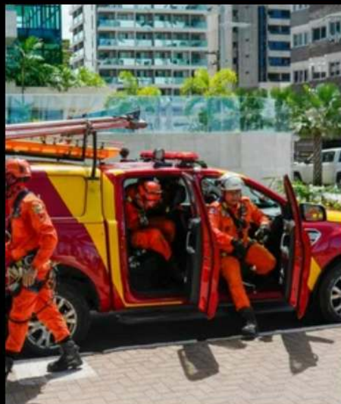
Corpo de Bombeiros participa de ação voltada à prevenção de acidentes e doenças ocupacionais

O Corpo de Bombeiros Militar de Alagoas (CBMAL) participou, neste domingo (12), de uma ação educativa voltada à conscientização sobre a prevenção de acidentes e doenças ocupacionais. O evento, promovido pelo Tribunal Regional do Trabalho da 19ª Região, foi realizado na Rua Fechada da orla da Ponta Verde, em Maceió.