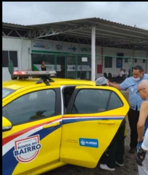
Ronda no Bairro faz atendimentos de assistência social e saúde em Maceió

Agentes do Programa Ronda no Bairro registraram, entre o domingo (1) e segunda-feira (2), duas ocorrências de assistência à comunidade nas regiões do Benedito Bentes e do Centro de Maceió. As ações envolveram o socorro clínico a um cidadão em via pública e o suporte social a uma pessoa em situação de rua.