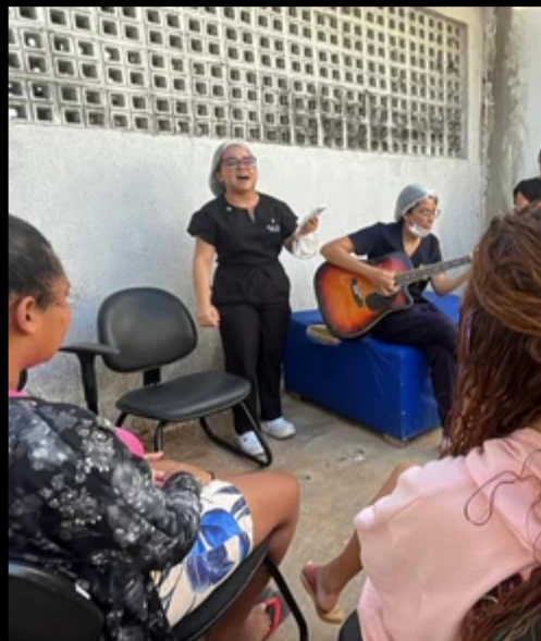
Musicoterapia humaniza atendimento e fortalece cuidado em saúde mental no Hospital Ib Gatto

Em alusão ao Janeiro Branco, campanha dedicada à conscientização sobre a importância da saúde mental, o Hospital Dr. Ib Gatto Falcão promoveu uma ação especial de musicoterapia voltada aos pacientes em acompanhamento na área. A iniciativa proporcionou momentos de escuta, expressão emocional e integração, contribuindo para o cuidado humanizado.