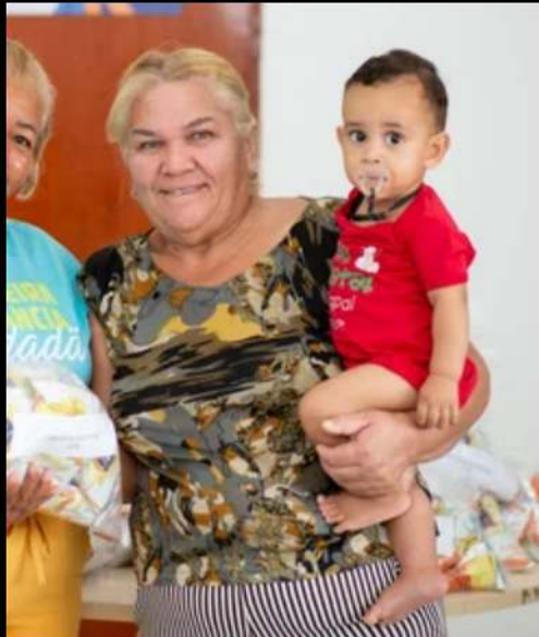
Primeira Infância Cidadã alcança marca de mais de 60 mil visitas domiciliares em 2025

Em 2025, o programa Primeira Infância Cidadã alcançou a marca de 60.597 visitas domiciliares. A iniciativa facilita o acesso de gestantes, de crianças na primeira infância e de suas famílias às políticas e aos serviços públicos que necessitam. A ação é executada por meio de visitas domiciliares que visam envolver ações de saúde, educação, assistência social, cultura e direitos humanos.